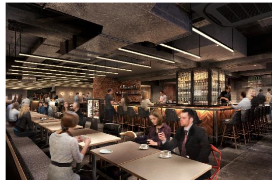
▲「KYOTO TOWER SANDO（京都タワー サンド）」完成イメージ