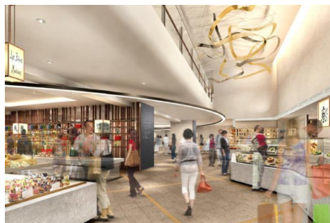
▲ 1階イメージパース

「京都らしい逸品が集まるマーケット」をテーマに、京都の和洋菓子から漬物、コスメ、カフェなど、京都好きの大人の女性にご満足いただけるこだわりの逸品を提供する31店舗が出店します。