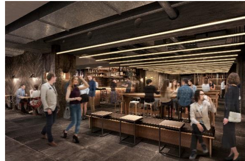
▲地下1階イメージパース

「京都を味わう食べ歩きが楽しいフードホール」をテーマに、地元の名店から話題の人気店までを揃えた、京都の食を堪能できる飲食フロアです。19店舗が出店し、店内カウンターを含め約400席を用意しました。フロア内は自由に飲食可能で、観光客はもちろん、深夜23時までの営業時間のため、仕事帰りの一杯等にも気軽に利用できます。